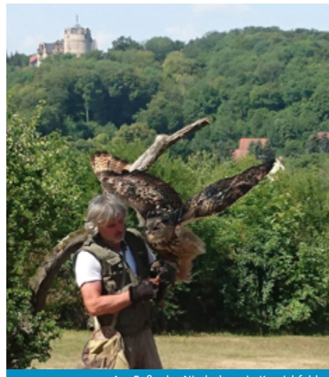
Am Fuße der Niederburg in Kranichfeld

Auf den Spuren des Malers radeln Sie von Dorf zu Dorf und erleben die Wirkungsstätten und Lieblingsmotive Feiningers. Im Jahr 1906 begab sich der amerikanische Maler erstmals nach Weimar um sich dort ein Atelier zu mieten. Über