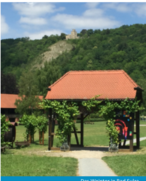
Das Weintor in Bad Sulza