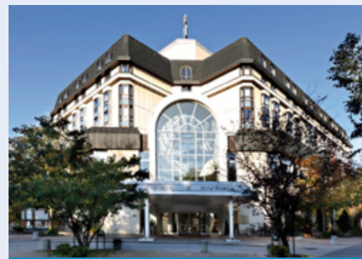
Das Leonardo Weimar liegt nahe der Altstadt

Durch die kürzere Tourvariante können Sie die Reisedauer individuell anpassen. Eine besondere Empfehlung ist die Kombination einer Weimar und einer Erfurt Sterntour. So lernen Sie nicht nur die Landeshauptstadt Thüringens sondern auch die Kulturhauptstadt des Freistaats bestens kennen.