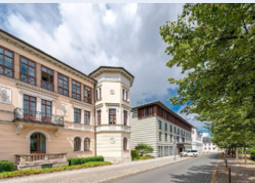
Das Dorint Hotel in Weimar